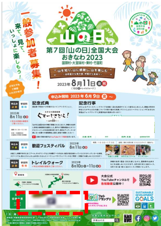
○大会PRチラシ（S～Bコース）