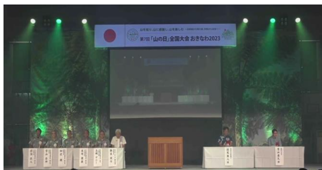
【第7回 沖縄大会 記念式典の様子】