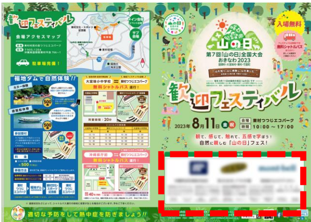
○大会プログラム（S～Dコース）