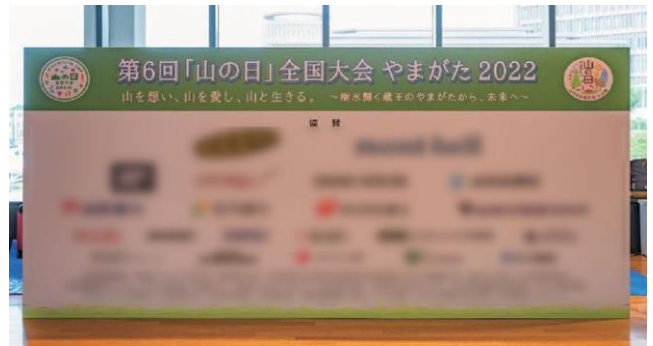
○記念式典会場（S～Cコース）